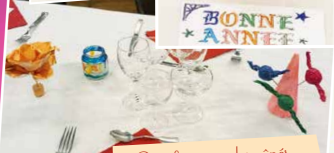
Pour le repas des aînés, les enfants ont réalisé la décoration des tables!..