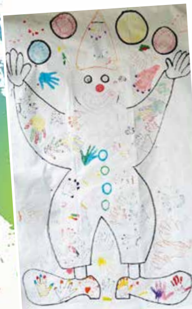
Monsieur Carnaval a été embelli par les mains colorées des enfants du service 1 de l'élémentaire.