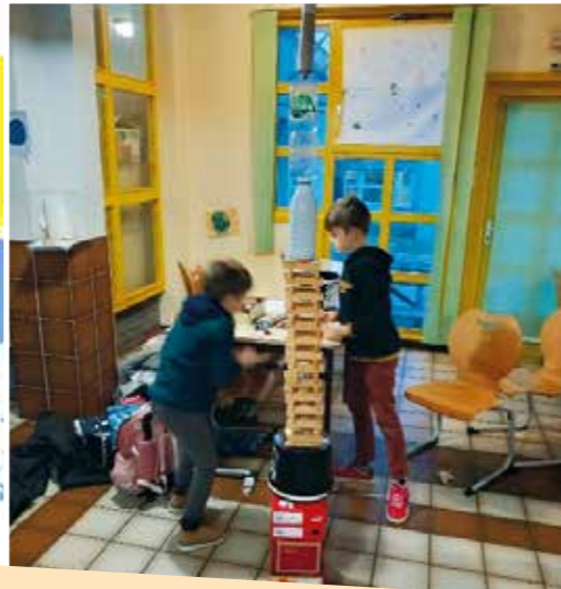
Sur l'accueil du soir, réalisation de la tour de Pise, avec tout ce que l'on trouve autour de nous lors de la journée du repas Italien.